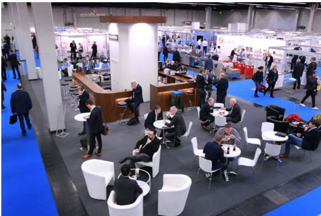
Bild Nr. 33-03 EF_Wissensaustausch.jpg. Fachbesucher der EMPACK 2019 und Logistics & Distribution können ihr Wissen zu ausgesuchten Themen der Logistikindustrie erweitern und austauschen.